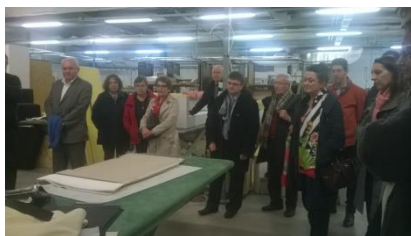
A Naves, entreprise Neology