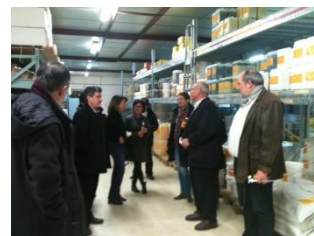
A Chamberet, entreprise Le Comptoir des plantes